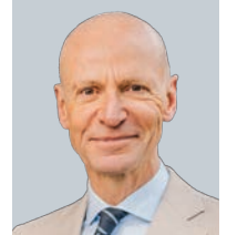
Gerd Kommer Gerd Kommer Invest