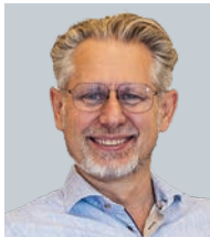
Walter Hell-Höflinger Gold&Co.