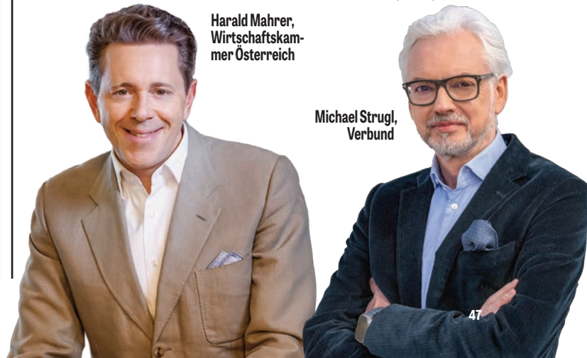
Harald Mahrer , Wirtschaftskammer Österreich